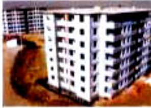
Er-Baki Top. Kompleksi'ni gösteren fotoğraf.