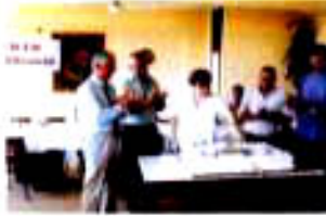
160 1600' lık OHSAD 1400' lüğüne ait bir toplantı odası.